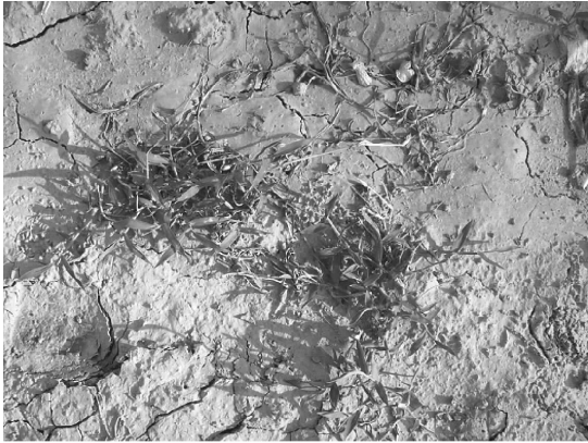
(a) 杂草原始图像 (a) Original weed image