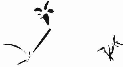
(b) 处理后图像 (b) The processed image