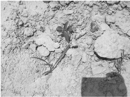
(a) 原始图像 (a) Original weed image