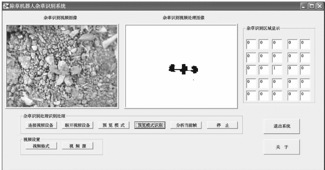
图 4 除草机器人杂草识别软件界面

利用 Visual C++ 开发工具编写了除草机器人杂草识别系统, 可以连续采集图像并实时处理, 主控界面如图 4 所示。